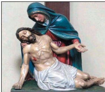
Pieta ze zábřežského kostela

Z některých kazatelen (v kostelech bez květin a se zahalenými obrazy) jsem slyšel, co všechno nesmíme dělat a jak se máme co nevíce zapírat. Bůh se mi tak do podvědomí dostával jako ten, který nám chce co nejvíce zkomplikovat život. A čím nám bude hůře, tím lépe... Velmi dobře si