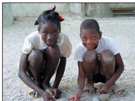
Děti z Baie de Henne