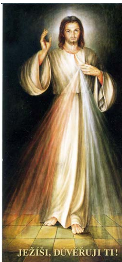
JEŽÍŠI, DŮVĚRUJI TI!

Svátek, který v roce 2000 ustanovil papež Jan Pavel II., na základě soukromého zjevení sestry Faustíny Kowalské, připadá každoročně na druhou neděli velikonoční.