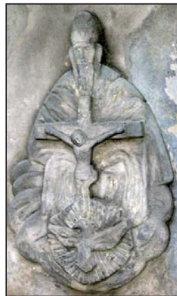
Trojice z kříže před farním kostelem v Zábřeze