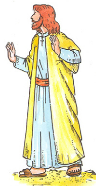
Pokoušení na poušti

Popeleční středou jsme vstoupili do doby postní. Tato doba nám připomíná období, kdy Pán Ježíš po svém křtu odchází na poušť, aby se zde o samotě modlil a připravoval se na budoucí činnost. Během té doby co přebýval na poušti a modlil se, přišel k němu ďábel a třikrát ho pokoušel. Pán Ježíš vždy pokušení odolal. Možná nás napadne, jak je možné, že si ďábel dovolil pokoušet samotného Boha, přestože Bůh má moc i nad veškerým zlem? Pán Ježíš se z lásky k nám stává skutečným člověkem a jako pokušení doléhá na každého z nás, mohlo útočit i na něj. Nejdůležitější poselství celé zprávy je, jakým způsobem se Pán Ježíš s pokušelem vypořádal. Ve zkoušce dokázal obstát, protože zaměřil svou pozornost na skutečné hodnoty (Boží slovo; důvěra, která nepřipouští zbytečné pokoušení Boha; Bůh vždy na prvním místě).