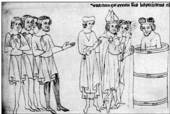
Pokřtění Bořivoje od arcibiskupa Metoděje. Velislavova bible (po roce 1340).

Kníže Rastislav se obával politického a náboženského vlivu německých kmenů a tak ze země dal latinsky mluvící kněze vyhnat. Sledoval však ještě vyšší zájmy. Chtěl církev využít, aby mu pomohla v úsilí o dosažení nezávislosti. Dobře pochopil, jaký význam má samostatná církevní organizace, která by nebyla řízena zvenčí, nýbrž byla pevně spjata se státem, a tak