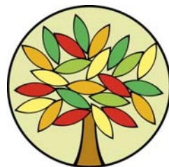
Logo nového časopisu

Mohlo by se zdát, že v době elektronických médií je pošetilé vydávat časopis tištěný na papíře. Přesto si myslíme, že je lepší vzít si do rukou na dotek příjemný a lehký časopis a číst si v křesle, na lavičce nebo na zahrádce, než vzít do náruče počítač a chtít dělat totéž. Projdeme se společně po známých i méně známých poutních místech Čech a Moravy, podíváme se, co je nového na zahradě, v truhlíku či květináči, a zeptáme se odborníka, co dělat v problémech, které nám někdy život připraví či jak jim předcházet. Nezapomeneme na vašeho domácího mazlíčka a nabídneme něco dobrého pro všední i sváteční stůl. A k tomu jako třešnička na dortu nějaké životní moudro, přísloví, pranostika, křížovka a trochu humoru, který je kořením života a neměl by nikdy chybět. To a mnohé další bude ke čtení a zamyšlení v novém časopise STROM barvy života.