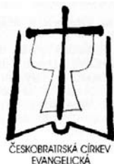
ČESKOBRATRSKÁ CÍRKEV EVANGELICKÁ