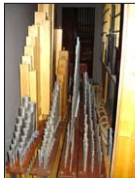
Pohled do varhanního stroje

PASTORAČNÍ RADA FARNOSTI JEDLÍ připravuje na závěr církevního roku v neděli 22. listopadu odpoledne o Slavnosti Ježíše Krále koncert v kostele sv. Jana Křtitele a poté posezení s občerstvením a programem v kulturním domě.