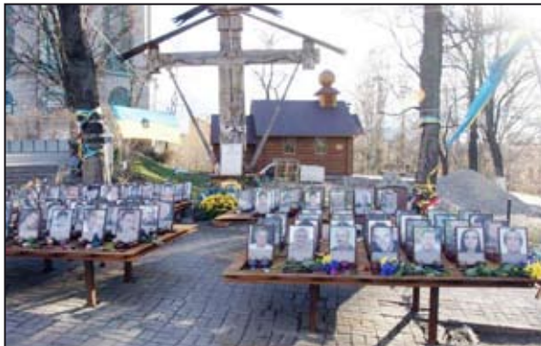
Fotky a jména zabitých na Majdanu

Ve dnech 30. 3. – 9. 4. jsem společně se svými spolupracovníky z Arcidiecézní charity Olomouc (ACHO) navštívil Ukrajinu, kde pomáháme už skoro dvacet let. Už během této cesty jsme zaregistrovali zprávu o tom, že papež František vyhlásil celoevropskou sbírku na pomoc této těžce zkoušené zemi. Tuto zprávu jsme přijali s velkou radostí a vděčností, protože vleklé krize a války na východě Ukrajiny jsou pro obyvatele tragické a dotklo se to lidí ve všech částech země.