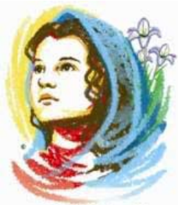
Saint Maria Goretti